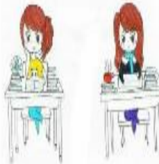
在同一个位置度过冬夏