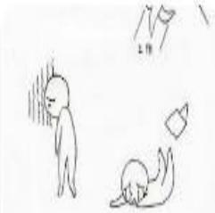
这过程中每天有人放弃