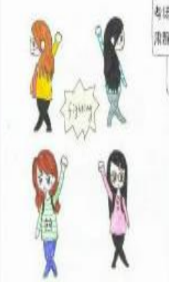
奔赴考场便已是勇士