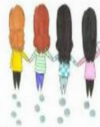
目的不同，却为同一目标相互扶持